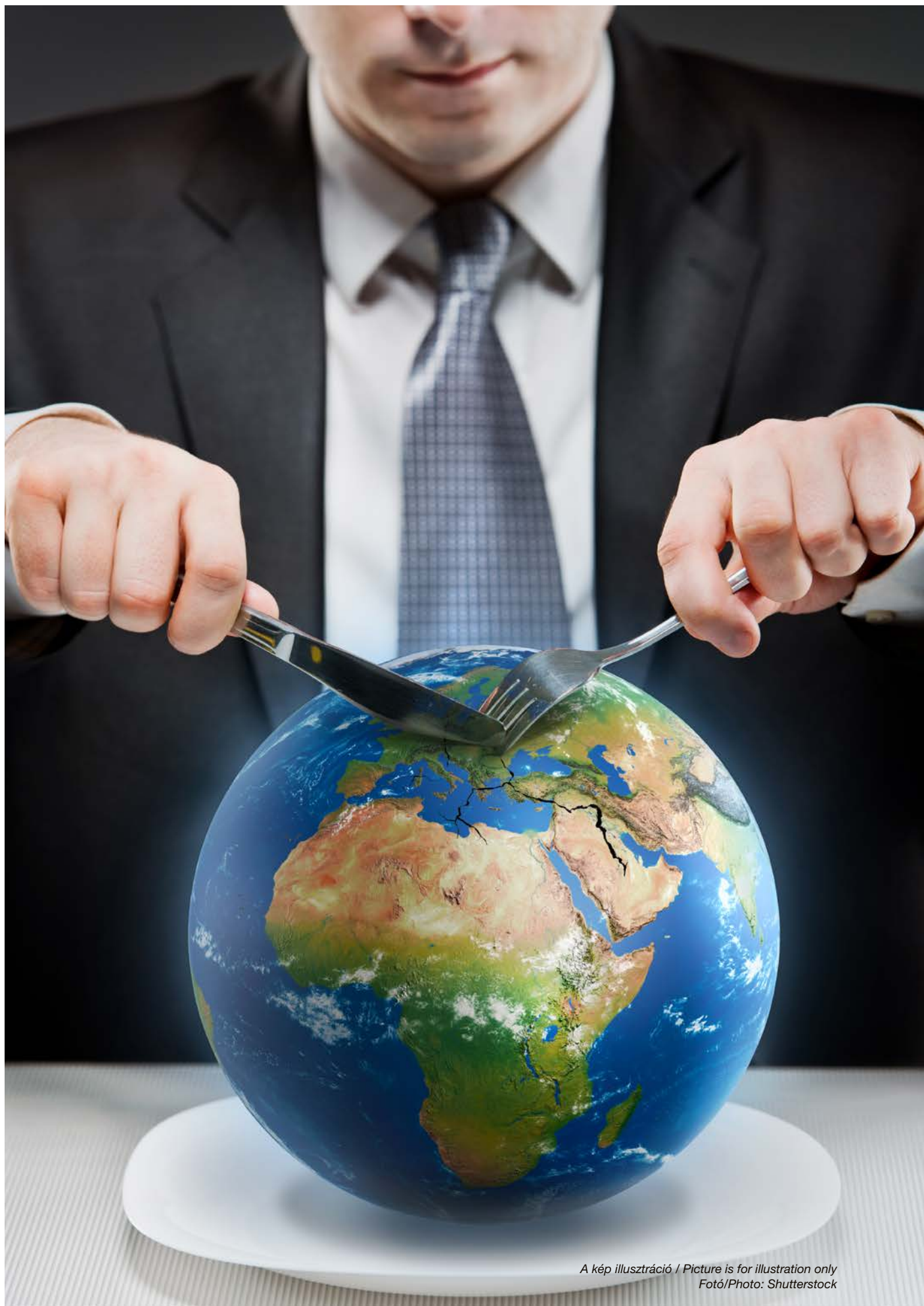
A kép illusztráció / Picture is for illustration only