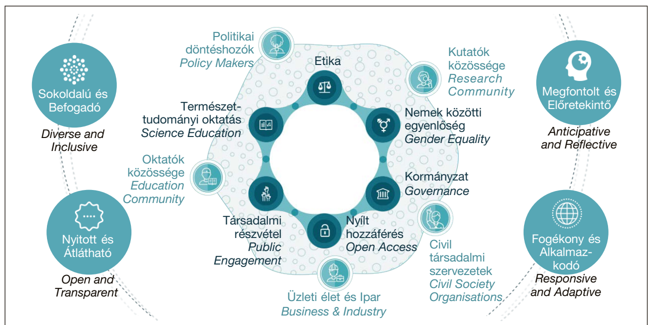
2. ábra. A felelősségteljes kutatás és innováció elemei

Az Egyesült Nemzetek Szervezete (ENSZ) 193 tagállama 2015 szeptemberében fogadta el a 2015 és 2030 közötti időszakra vonatkozó új integrált fenntartható fejlődési és fejlesztési keretrendszert, az Agenda 2030-at ( Transforming our world: The 2030 Agenda for Sustainable Development ), amely a szegénység megszüntetéséhez, az egyenlőtlenségek leküzdéséhez, Földünk környezeti rendszerének megóvásához vázol fel elképzeléseket. Az Agenda középpontjában a Fenntartható Fejlődési Célok ( Sustainable Development Goals, SDG ) állnak. A 17 célt és a hozzájuk tartozó 169 részcejt a fenntarthatóság