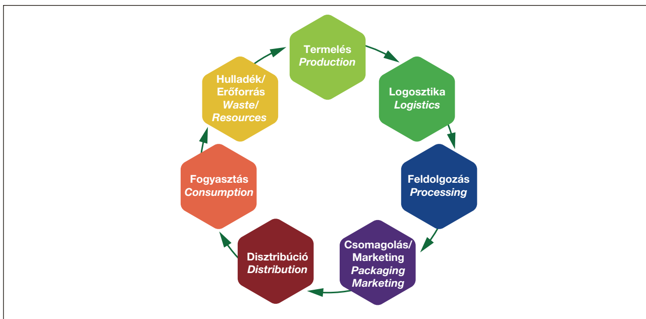
1. ábra. Az élelmiszer-ellátó rendszer főbb elemei Figure 1. Key elements of the food supply system

Annak ellenére, hogy a táplálkozási szokások és a termesztési gyakorlatok szerte a világon jelentős eltéréseket mutatnak, napjainkban az emberiség élelmiszerigényének 95%-át mindössze harminc növényfaj fedezi. Mindez kedvezőtlen hatással van a talaj minőségére, a fajok sokféleségére és az ökoszisztéma ellenálló képességére egyaránt. Görögországban például a helyi gabonafajták 95%-a eltűnt, míg Olaszországban annak ellenére, hogy a 19. század elején írt kézikönyvek még száz almafajtát ismertettek, napjainkra a termesztés 80%-át alig három típus adja. Hasonló a helyzet az állattenyésztés terén: azok az állatfajták, amelyek gyorsabb növekedésre képesek, háttérbe szorítják a lassabban növekvő helyi fajtákat [13].